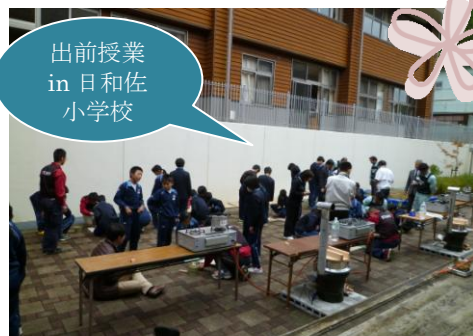
出前授業 in 日和佐 小学校