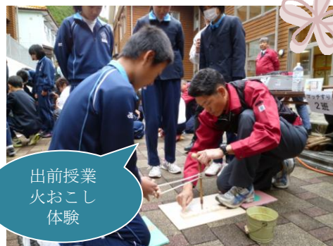
出前授業 火おこし 体験