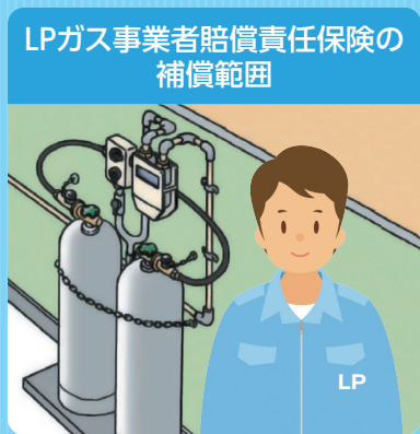
LPガス事業者賠償責任保険の 補償範囲

LPガス事業者様が行うLPガス業務以外の事業活動について生じる対人・対物事故による法律上の賠償責任を補償する特約です。