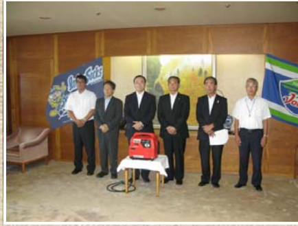
8月23日 徳島県庁 贈呈式